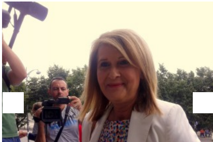
Σύμφωνα με την κυβερνητική εκπρόσωπο θα υπάρξουν... ΔΕΘ 2014