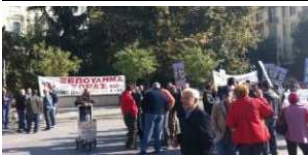
Πέντε συγκεντρώσεις διαμαρτυρίας σήμερα στη Θεσσαλονίκη