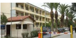
Κρήνη: Ζήτησε τα ένσημα του και κατέληξε στο νοσοκομείο