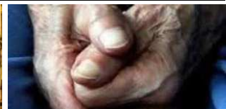
ΤΩΡΑ: Λήστεφαν και χτύπησαν ηλικιωμένο στο κέντρο της Θεσσαλονίκης