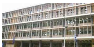
Δήμος Πυλαίας-Χορτιάτη: Συγκέντρωση διαμαρτυρίας για