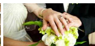
Επάγγελμα "Νύφη": Το φαινόμενο των λευκών γάμων που