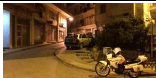
ΤΩΡΑ: Νεκρός ο ηλικιωμένος που έπεσε θύμα ληστείας στο διαμέρισμά του στο κέντρο της Θεσσαλονίκης