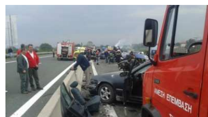
Πολύνεκρο δυστύχημα στην Εγνατία Οδό