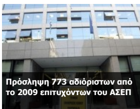
Πρόσληψη 773 αδιόριστων από το 2009 επιτυχόντων του ΑΣΕΠ