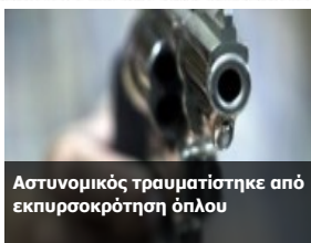
Αστυνομικός τραυματίστηκε από εκपुरσοκρότηση όπλου