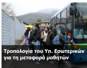
Τροπολογία του Υπ. Εσωτερικών για τη μεταφορά μαθητών