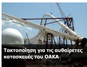
Τακτοποίηση για τις αυθαίρετες κατασκευές του ΟΑΚΑ