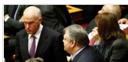
Ταβανόπροκα Βενιζέλου κατά