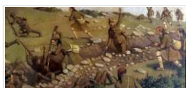
Η Μάχη του Σαρανταπόρου, 9-