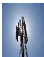
Ο δήμος και