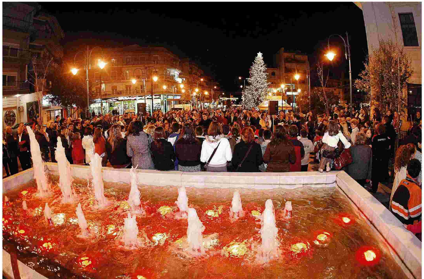
Οι δήμοι της Θεσσαλονίκης άρχισαν ένας ένας να περνούν στον αστερισμό των Χριστουγέννων, καθώς φωταγωγούν τους κεντρικούς δρόμους και τις πλατείες, ανάβουν τα χριστουγεννιάτικα δέντρα, δημιουργώντας ξεχωριστή ατμόσφαιρα ενόψει των εορτών. ΦΩΤ. ΑΡΧΕΙΟΥ

Στα σπιτάκια θα πραγματοποιούνται δράσεις, όπως ξυλογλυπτική, χαρτοκοπική, ζαχαροπλαστική κ.ά., στις οποίες θα συμμετέχουν δημιουργικά τα παιδιά όλων των ηλικιών. Στον περιβάλλοντα χώρο προγραμματίζονται τόσο αθλητικές (τουρνουά ποδοσφαίρου και καλαθοσφαίρισης με συμμετοχή αθλητικών σλλόγων της ευρύτερης περιοχής και επώνυμων αθλητών) όσο και καλλιτεχνικές εκδηλώσεις, όπως συναυλίες, φιλαρμονικές του δήμου, τοπικά μουσικά σχήματα, μαθητικές μπάντες, χορωδίες και άλλα πολλά. Επίσης, θα υποστηριχθούν δράσεις εθελοντισμού και κοινωνικής