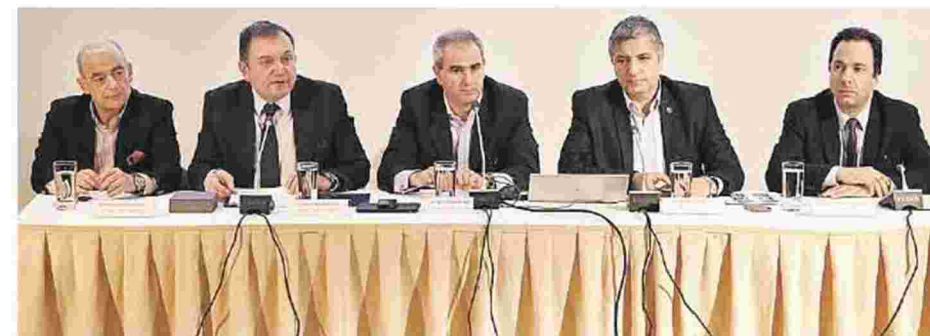
Τη λειτουργία του ΚΕΠ ανακοίνωσαν μεταξύ άλλων ο δήμαρχος Πυλαίας Χορτιάτη, Ιγνάτιος Καϊτεζίδης και ο δήμαρχος Αμαρουσίου, Γιώργος Πατούλης

φωση, και το πρώτο στη Βόρεια Ελλάδα. Επιθεώρησαν τους χώρους, συνομίλησαν με τους εργαζόμενους και παρέδωσαν τις πρώτες συσκευές άμεσης κλήσης βοήθειας («κουμπιά πανικού») σε ηλικιωμένους δημότες που βρίσκονταν στο κέντρο.