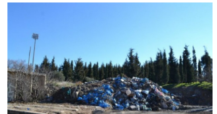
Χωματερή ξανά το πρώην στρατόπεδο Κόδρα