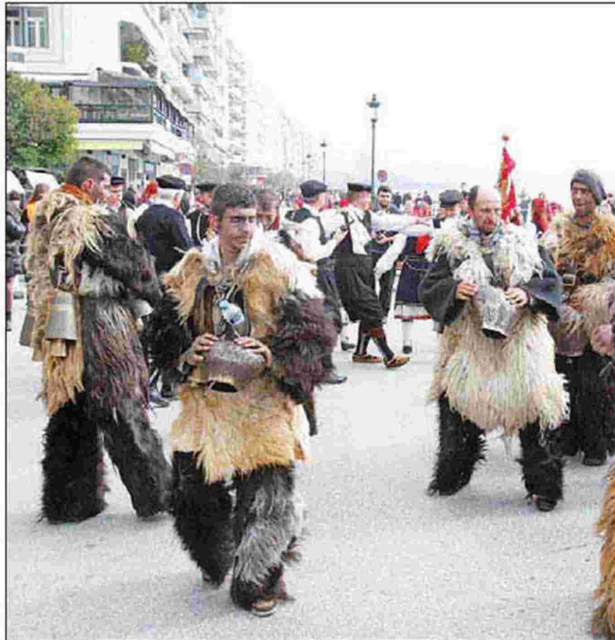
Οι κωδωνοφόροι του Σοχοῦ ξεσηκώνουν τους πάντες με κουνούνια και κρουστά (από την παρέλαση που έκαναν πρόσφατα στο κέντρο της Θεσσαλονίκης)