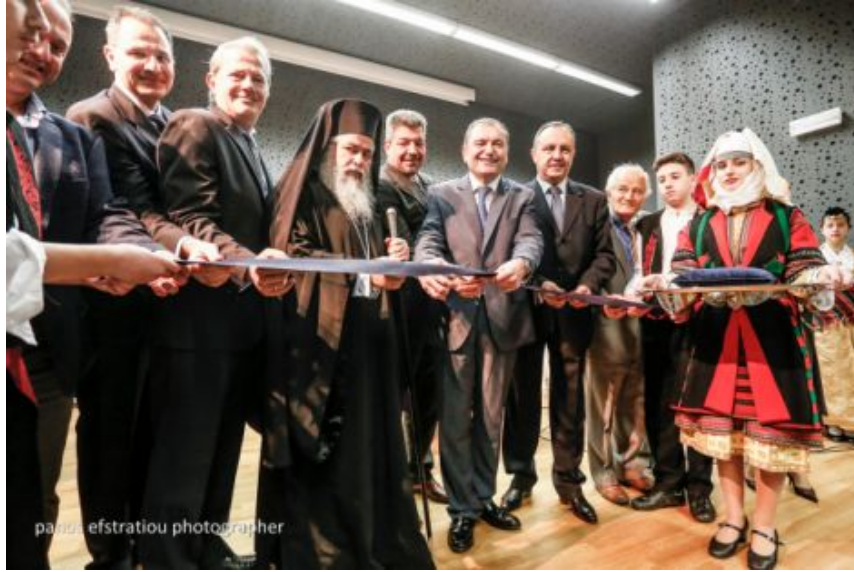
panos efstratiou photographer