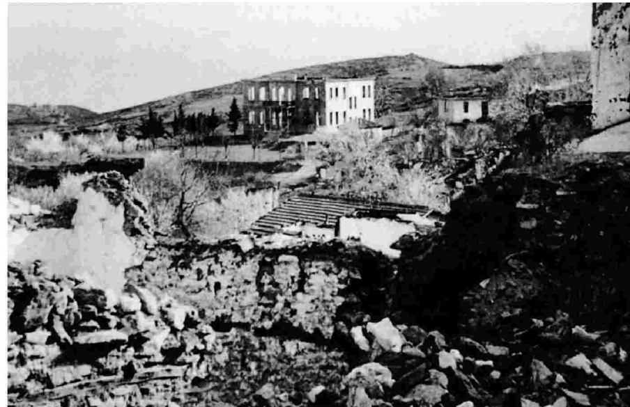
Ο Χορτιάτης μετά το Ολοκαύτωμα. Στο βάθος διακρίνεται το καμένο δημοτικό σχολείο.