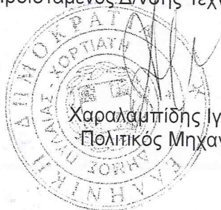
Χαραλαμπίδης Ιγνάτιος Πολιτικός Μηχανικός