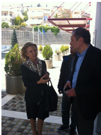
Ο καλύτερος δήμαρχος μαζί με την Βόζεμπεργκ

Με αισιοδοξία παρά τις δυσκολίες των καιρών και με ένα πλούσιο και ποιοτικό πρόγραμμα καλλιτεχνικών εκδηλώσεων που ανοίγουν την αυλαία τους με την καθιερωμένη αφή των χριστουγεννιάτικων δένδρων και στις έξι δημοτικές κοινότητες, υποδέχεται ο δήμος Πυλαίας-Χορτιάτη τα φετινά Χριστούγεννα.