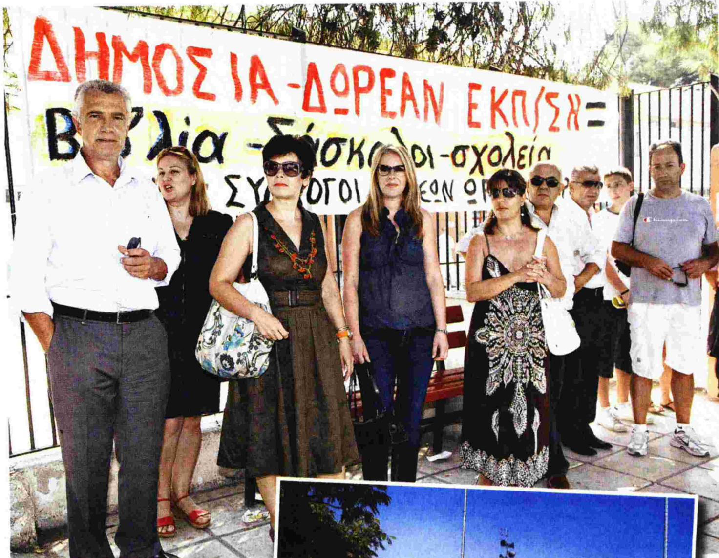
Συγκέντρωση διαμαρτυρίας διοργάνωσε χτες η Ένωση Γονέων Ωραιοκάστρου μπροστά στο 1ο Δημοτικό Σχολείο της περιοχής για το θέμα των βιβλίων και της σχολικής στέγης