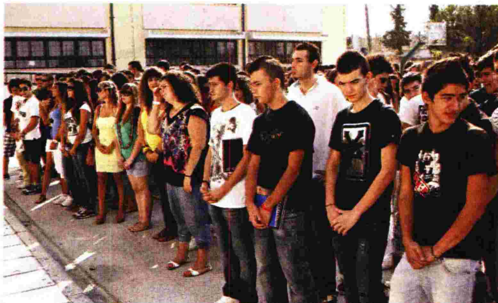
Το χτεσινό πρώτο... κουδούνι σε σχολεία του νομού Θεσσαλονίκης συνοδεύτηκε από διαμαρτυρίες για την απουσία βιβλίων και για τα οξύτα προβλήματα σχολικής στέγης

Πάντως, οι καθυστερήσεις, οι παλινοδίες και η προχειρότητα στον προγραμματισμό για τις σχολικές υποδομές έχουν προκαλέσει μία ασφυκτική κατάσταση σε ορισμένες περιοχές του νομού, όπου επιστρατεύονται υπόγεια, κοντίνερ, μισθωμένα καταστήματα και διάδρομοι χωρισμένοι με γυψοσανίδες για την κάλυψη των αναγκών. Ομως και η διπλοβάρδια εξακολουθεί να ταλανίζει εκατοντάδες οικογένειες, αν και ποσοστό φέρεται να έχει μειωθεί κάτω από το 10% στο νομό. Η δημοτική ενότητα της Πολίχνης θεωρείται «βασιλείο» της διπλοβάρδιας με το 40% των διδασκτριών της δευτεροβάθμιας σε διπλό κύκλο, με ό,τι αυτό συνεπάγεται για την καθημερινότητα των παιδιών, ειδικά της γ' λυκείου. Ήδη, εδώ και τρία χρόνια καταγράφονται φαινόμενα μετεγγραφών