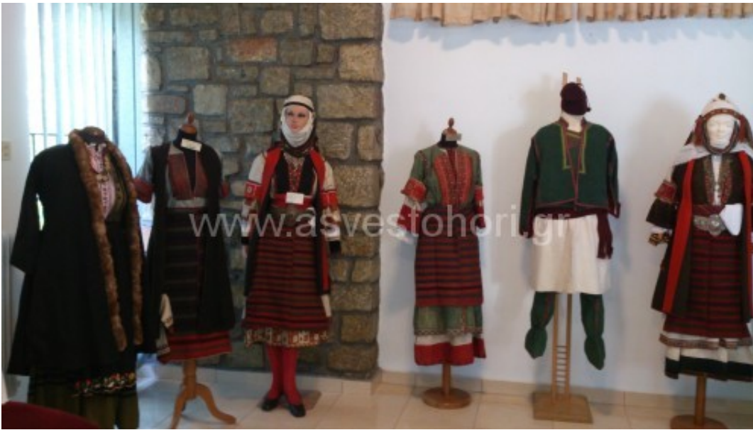
Ορισμένες από τις παραδοσιακές Ασβεστοχωρίτικες φορεσιές που εκτίθενται στην αίθουσα της Φιλοπτώχου Αδελφότητας Γυναικών Ασβεστοχωρίου

Με τη συμμετοχή χορευτών από 25 Πολιτιστικούς Συλλόγους της Μακεδονίας και τη Θεσσαλίας πραγματοποιείται την Κυριακή 11 Μαΐου, στο Ασβεστοχώρι, το 13ο Συμπόσιο Χορευτικών Ομάδων, που διοργανώνει ο Μουσικοχορευτικός – Λαογραφικός Σύλλογος Ασβεστοχωρίου. Πρόκειται για ένα «χορευτικό αντάμωμα» που πραγματοποιείται κάθε χρόνο σε άλλη περιοχή. Για μία ξεχωριστή παραδοσιακή γιορτή μουσικής και χορού, κατά την οποία οι επισκέπτες θα έχουν την ευκαιρία να γνωρίσουν τον τόπο μας και τους ανθρώπους του. Σύμφωνα με τους διοργανωτές αναμένεται να συμμετάσχουν συνολικά περίπου 400 χορευτές, οι οποίοι μετά την άφιξή τους, που υπολογίζεται γύρω στις 10.30 – 11 το πρωί, θα μεταβαίνουν κατά ομάδες στην αίθουσα της Φιλοπτώχου Αδελφότητας Κυριών Ασβεστοχωρίου, στην οποία εκτίθενται παραδοσιακές Ασβεστοχωρίτικες φορεσιές καθώς και άλλα παραδοσιακά αντικείμενα. Στη συνέχεια θα ενημερώνονται, στον ίδιο χώρο, για την ιστορία του Ασβεστοχωρίου, καθώς και για άλλα ενδιαφέροντα θέματα που αφορούν την ιστορική μας κωμόπολη. Κατόπιν θα επισκέπτονται τον ιερό ναό Αγίου Γεωργίου, που είναι κτισμένος το 18 ο αιώνα. Ακολούθως θα υπάρχει ελεύθερος χρόνος για βόλτα και στη 1 το μεσημέρι θα μεταβούν στην ειδικά διαμορφωμένη αυλή του 1 ου και 2 ου Δημοτικού Σχολείου για γεύμα συνοδεία παραδοσιακής μουσικής από οργανοπαίκτες και χορούς από διάφορες περιοχές. Νίκος Γιώτης Η Φιλόπτωχος Αδελφότης Κυριών και ο Μουσικοχορευτικός Σύλλογος Ασβεστοχωρίου έκοψαν τις βασιλόπιτες τους