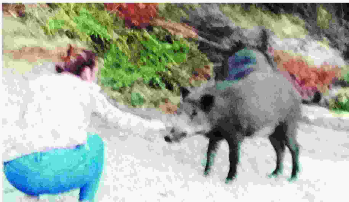
Εκπληκτικοί οι κάτοικοι του Πανοράματος, της Εξοχής, του Χορτιάτη, του Ασβεστοχωρίου, των Πεύκων και του Ρετζικίου αντικρίζουν καθημερινά στους δρόμους τους απρόσκλητους επισκέπτες. Μερικοί δεν ξέρουν πώς να αντιδράσουν, άλλοι όμως το διασκεδάζουν κι έρχονται κοντά με τους αγριόχοιρους.

03 Το επιλεκτικό κυνήγι. Στις χώρες κυρίως της Κεντρικής Ευρώπης το κυνήγι ασκείται με κανονισμούς που απορρέουν από ανάλογο διαχειριστικό σχέδιο και τα σχέδια αυτά εδώ και πέντε δεκαετίες είχαν ως σκοπό την αύξηση των πληθυσμών διά της επιλεκτικής θήρευσης. Η μέθοδος αυτή του κυνηγιού πέρασε στην κουλτούρα των κυνηγών, πράγμα που είναι δύσκολο ν' αλλάξει.