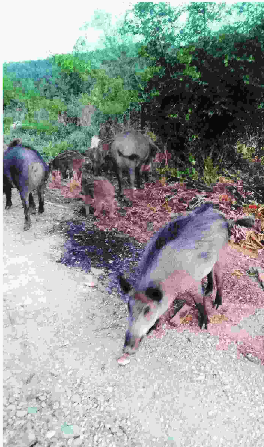
Στις αυλές των σπιτιών βορείων προαστίων της Θεσσαλονίκης άρχισαν να εισβάλλουν αγριόχοιροι που κατέρχονται από το δάσος του Σείχ Σου, αναζητώντας τροφή στην ανθρώπινη δραστηριότητα.

ως βασική αιτία την ανάπτυξη ενός υβριδίου αγριόχοιρου, που προέκυψε από διασταύρωση ήρεμων και άγριων χοίρων. Το υβρίδιο αυτό πολλαπλασιάζεται ραγδαία τα τελευταία χρόνια στην Ελλάδα, όπως συμβαίνει και στην υπόλοιπη Ευρώπη.