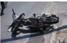
ΤΩΡΑ: Μοτοσυκλέτα έπεσε πάνω σε κοπάδι ζώων στην Θεσσαλονίκη