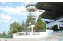
Ανοιχτό το Βελλίδειο για το κοινό λόγω υψηλών θερμοκρασιών