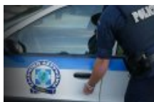
Βέροια: 19χρονη μπήκε σε κατάσταση και άρπαξε χρήματα από την ταμιακή