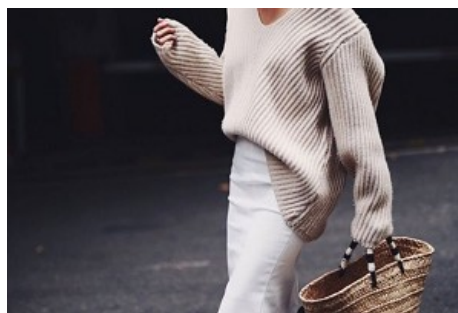
Αυτό θα 'ναι το χαρακτηριστικό του χειμώνα!