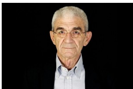
Τα σχέδια Μπουτάρη από δω και προς