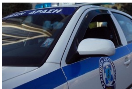
Νεκρός σε ακάλυπτο στο κέντρο της Θεσσαλονίκης