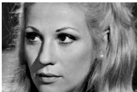
Ο θάνατος της Ζωής