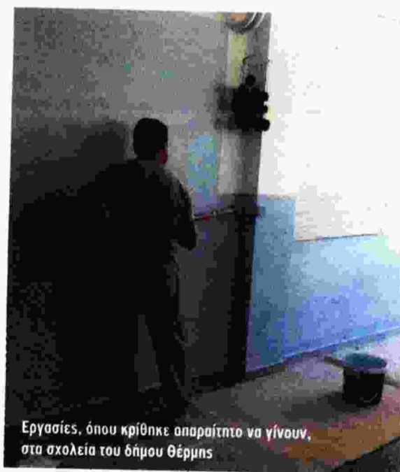
Εργασίες, όπου κρίθηκε απαραίτητο να γίνουν, στα σχολεία του δήμου Θέρμης