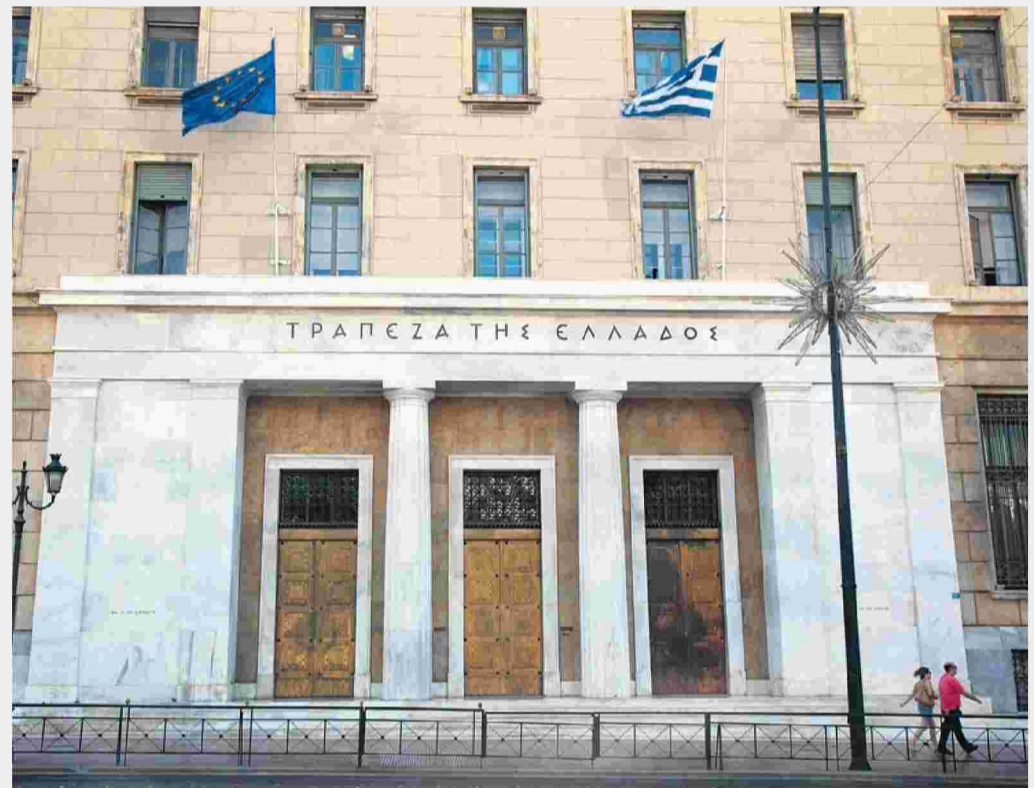
Στις 21 Σεπτεμβρίου ακολουθεί έγγραφο του υπουργείου Εσωτερικών (πάνω δεξιά) προς τις αποκεντρωμένες διοικήσεις του κράτους και τους ΟΤΑ για τη μεταφορά των αποθεματικών τους που ξεπερνούν τα 2 δισ. ευρώ.

εξαμήνου 3,15%. Το πρόβλημα που ενδέχεται να ανακύψει έχει να κάνει με τη ρευστότητα της οικονομίας και της αγοράς, γιατί το κράτος χρωστά αυτή τη στιγμή κοντά στα 6 δισ. ευρώ, που δεν επαρκούν να πληρωθούν από το ποσό των ληξιπρόθεσμων οφειλών που ενέκρινε η τρόικα! Επιπρόσθετα η στέρση ρευστότητας καθιστά ανεφάρμοστο και τον όρο της τρόικας ότι για να παίρνουν επιχορήγηση για τα ληξιπρόθεσμα χρέη προς τους πολίτες οι φορείς που τα χρωστούν θα βάζουν το 50% από την τσέπη τους! Πώς θα γίνουν άραγε πληρωμές, όταν τα διαθέσιμα τους θα είναι στην Τράπεζα Ελλάδος και θα χρειάζεται αίτημα και έγκριση εκταμίευσης; Οι δήμοι διαθέτουν ως ρευστότητα που