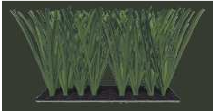
Ενδεικτική εικόνα τρόπου πλέξης

Οι ίνες δημιουργούν ύψος πέλους 50 χιλ και άνω. και αγκυρούνται εντός της πρωτεύουσας, πλήρως υδατοπερατής βάσης, από διπλή διαστρωμάτωση υφάσματος πολυπροπυλαινίου (PP) και είναι ιδιαίτερα ισχυρά συνδεδεμένες με την επιφάνεια διά επιπίεσεως, από πολυουρεθάνη και όχι LATEX