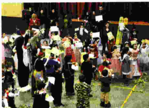
Η χαρά του μικρού παιδιού

Δενδροφυτεία Συκεών, με την Πανωραία και τη μουσική της παρέα.