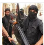
Συνελήφθη Αλβανός του Κοσόβου ως ...