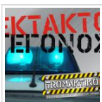
ΕΚΤΑΚΤΟ: Ληστεία στα ΕΛΤΑ ...