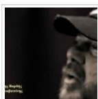
Δείτε τη τελευταία ηχογράφηση του Αντώνη ...