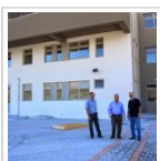
Αγώνας δρόμου για το νέο λύκειο ...