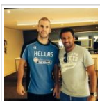
Πλησιάζουμε στη λύση του μυστηρίου: Αυτός ...