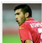
Μετακομίζει Πλατεία ο ...