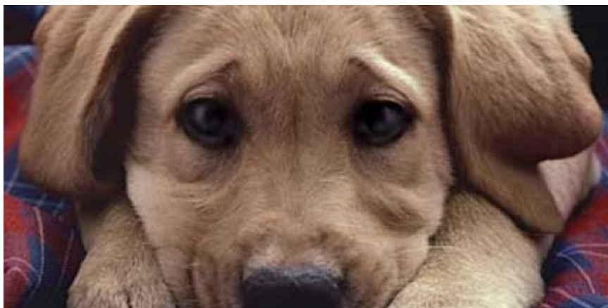
Ζωτροφές και φάρμακα για τα αδέσποτα ζώα του Δήμου Πυλαίας