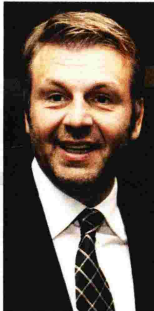
Ο Απόστολος Γκλέτσος.