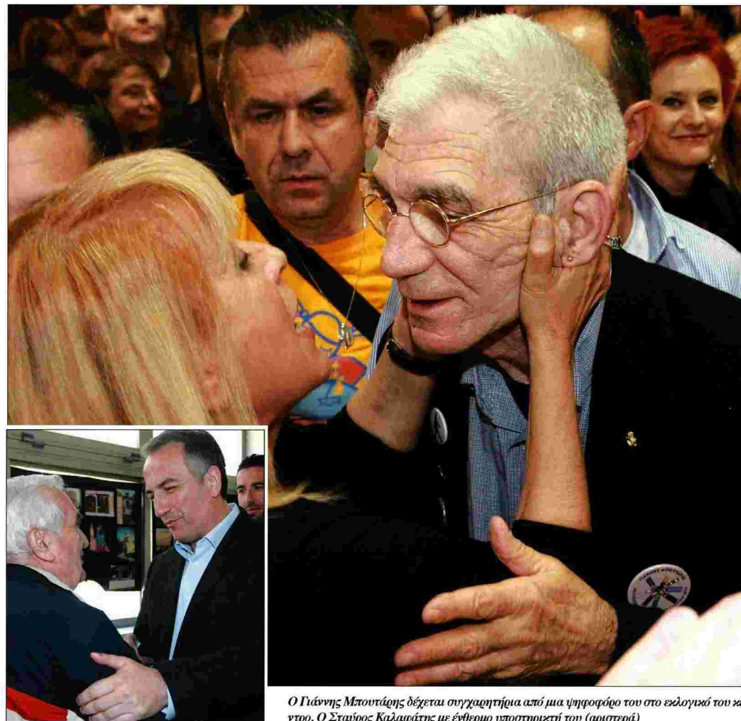
Ο Γιάννης Μπουτάρης δέχεται συγχαρητήρια από μια ψηφοφόρο του στο εκλογικό του κέντρο. Ο Σταύρος Καλαράτης με ένθετο υποστηρικτή του (αριστερά)

Σχετικά εύκολη υπόθεση φαίνεται ότι θα είναι ο δεύτερος γύρος και στον Δήμο Βόλβης, όπου θα αναμετρηθούν οι Δημήτρης Σιστόσας και Διαμαντής Λιάμας, με τον δεύτερο να έχει λάβει ποσοστό άνω του 45% στον πρώτο γύρο και να θεωρείται σίγουρο φαβορί.