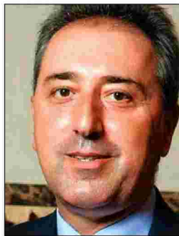
Ο Θεοδόσης Μπακογιάννης