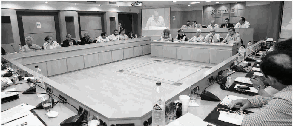
Η μορφή των κινητοποιήσεων των δημάρχων θα αποφασιστεί στο έκτακτο συνέδριο που συγκαλεί η Κεντρική Ένωση Δήμων Ελλάδας (ΚΕΔΕ) στις 30 Αυγούστου.

«Δεν βρισκόμαστε απλώς σε νευρική κρίση, αλλά σε πλήρη απόγνωση. Οι περικοπές που σχεδιάζονται δεν θα επιτρέψουν στους περισσότερους δήμους να πληρώσουν ούτε τη μισθοδοσία, πολύ πε-