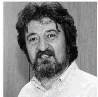
Οι περικοπές που σχεδιάζονται δεν θα επιτρέψουν στους περισσότερους δήμους να πληρώσουν ούτε τη μισθοδοσία, πολύ περισσότερο να λειτουργήσουν βασικές υπηρεσίες», τόνισε ο πρόεδρος της ΠΕΔ Κεντρικής Μακεδονίας, Σίμος Δανιηλίδης.

Ακόμα, οι δήμαρχοι πρόκειται να εξετάσουν και το ενδεχόμενο να προσφύγουν στα αρμόδια ευρωπαϊκά δικαστήρια, προκειμένου να σταματήσουν οι προαναγγελλόμενες μειώσεις χρηματοδοτήσεων των δήμων για τη διετία 2013-2014.