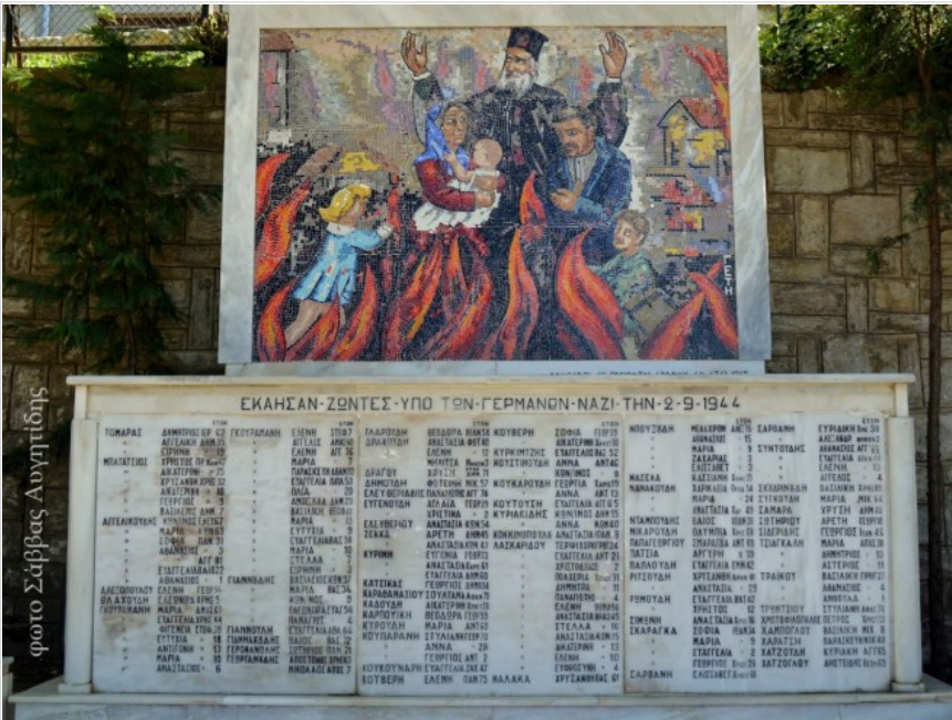
φωτο Σάββας Αυγητίδης

Ετικέτες: δήμαρχος Πυλαίας Χορτιάτη, δήμος Πυλαίας-Χορτιάτη, εκδηλώσεις, εκδηλώσεις μνήμης, Ιγνάτιος Καϊτεζίδης, Καρφίτσα, λεύκωμα δήμου Πυλαίας Χορτιάτη, Μιχάλη Γεράνη, ολοκαύτωμα, φωτο Σάββας Αυγητίδης