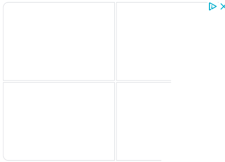
Michael Kors - Glot

Στην εκδήλωση που πραγματοποιήθηκε στο αμφιθέατρο “Σταύρος Κουγιουμτζής”, στο Πανόραμα έγινε παρουσίαση του “U Report”, σε περισσότερους από 150 μαθητές, γυμνασίων και λυκείων του δήμου. Σχεδόν το σύνολο των μαθητών που ήταν παρόντες εγγράφηκαν άμεσα στην πλατφόρμα και απάντησαν στην πρώτη δημοσκόπηση με θέμα «Τι θα θέλατε από τις τοπικές αρχές για να γίνουν οι πόλεις σας πιο φιλικές προς τα παιδιά και τους νέους;». Τα αποτελέσματα θα αποτελέσουν τη μαγιά για την κατάρτιση των σχεδίων δράσης στο πλαίσιο του Προγράμματος «Πόλεις Φιλικές προς τα Παιδιά», στο οποίο ο δήμος Πυλαίας Χορτιάτη έχει προσχωρήσει ως υποψήφια πόλη.