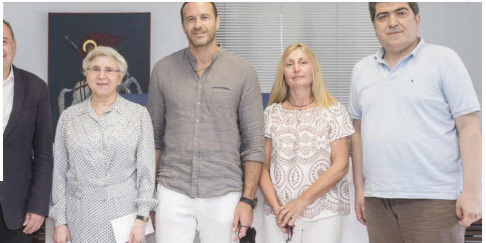
22/07/2022 11:30 | THESTIVAL TEAM