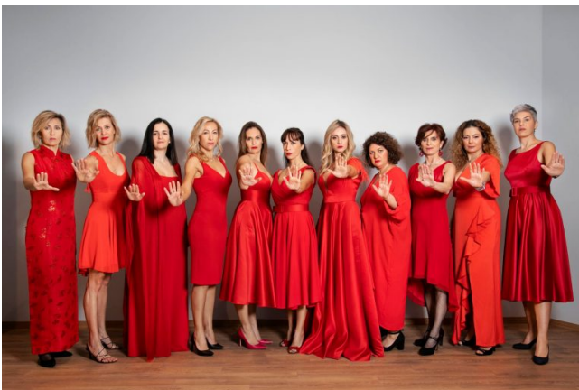
Κόκκινο στην κακοποίηση των γυναικών

Μήνυμα κατά της γυναικείας κακοποίησης έστειλαν το Σάββατο 27/11 επώνυμες γυναίκες της Θεσσαλονίκης σε εκδήλωση που πραγματοποιήθηκε στην αίθουσα «Λίτσα Φοκίδη» του δημαρχείου Πανοράματος. Η εκδήλωση πραγματοποιήθηκε με αφορμή την Διεθνή Ημέρα για την Εξάλειψη της Βίας κατά των Γυναικών, είχε τίτλο «The REDRESS Project against woman violence» και συνδιοργανώθηκε από την Αντιδημαρχία Πολιτισμού και Τουρισμού του δήμου Πυλαίας-Χορτιάτη και τον Αντιδήμαρχο Σοφοκλή Κάλτσιο και την εταιρία «Groupe Rich».