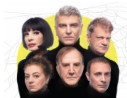
«Η Παγίδα» θέατρο Γης. Πλάνα & χειροκρότημα