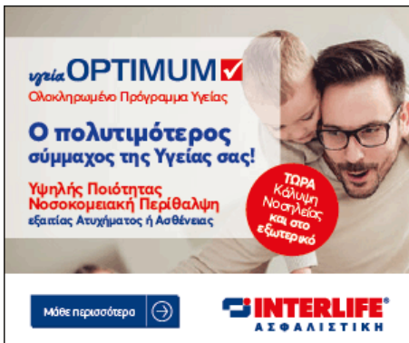
( https://www.interlife-programs.gr/ygeiaoptimum/ )