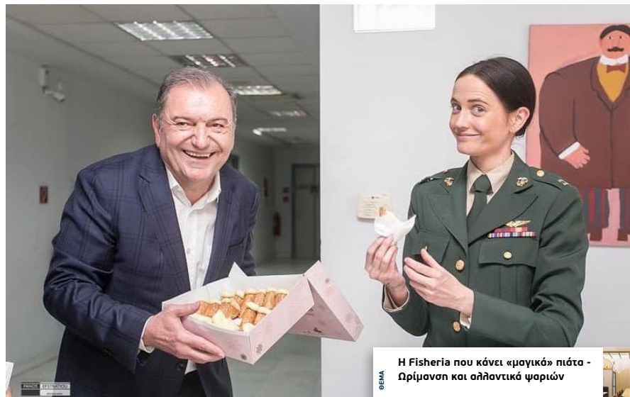
Η Fisheria που κάνει «μαγικά» πιάτα - Ωρίμανση και αλλαντικά ψαριών