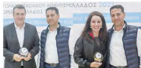
Ο Περιφερειάρχης Απόστολος Τζιτζικώστας και η πρόεδρος του Οργανισμού Τουρισμού, Βούλα Πατουλίδου τιμήθηκαν από τον πρόεδρο της οργανωτικής επιτροπής, Σπύρο Καραβούλη