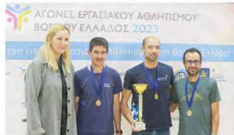
Η Ολυμπιονίκης Τασούλα Κελεσιδου σε απονομή διακρίσεων στους αγώνες