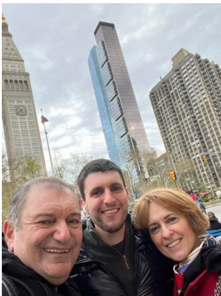
Με φόντο τους ουρανοξύστες: επίσκεψη με τη σύζυγό του στη Νέα Υόρκη, όπου τα τελευταία χρόνια εργάζεται ο γιος τους.