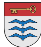
MUNICIPALITY OF MOLETAI (LITHUANIA)