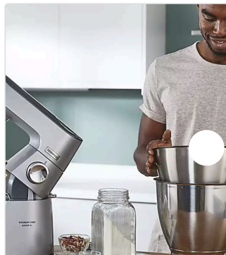
Δύο κάδους χωρητικότητας 7L & 5L που αποθηκεύονται ο ένας μέσα στον άλλο