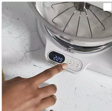
Ενσωματωμένη Ζυγαριά για ζύγισμα απευθείας στον κάδο, στα εξαρτήματα ή