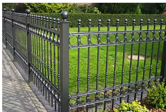
Athens: Οι πολωνικοί μεταλλικοί φράχτες τώρα κοστίζουν σχεδόν τίποτα (Ρίξτε μια ματιά)