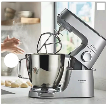
Κουζίνομηχανή Kenwood Titanium Chef Baker XL

sponsored by Kenwood Μπορεί το μίξερ σας να κάνει τα πάντα;