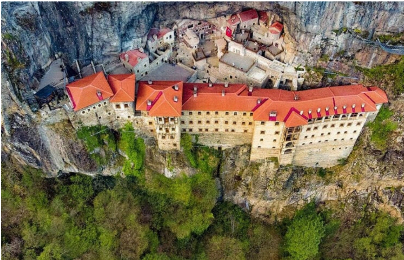
Η ιστορική μονή της Παναγίας Σουμελά από ψηλά