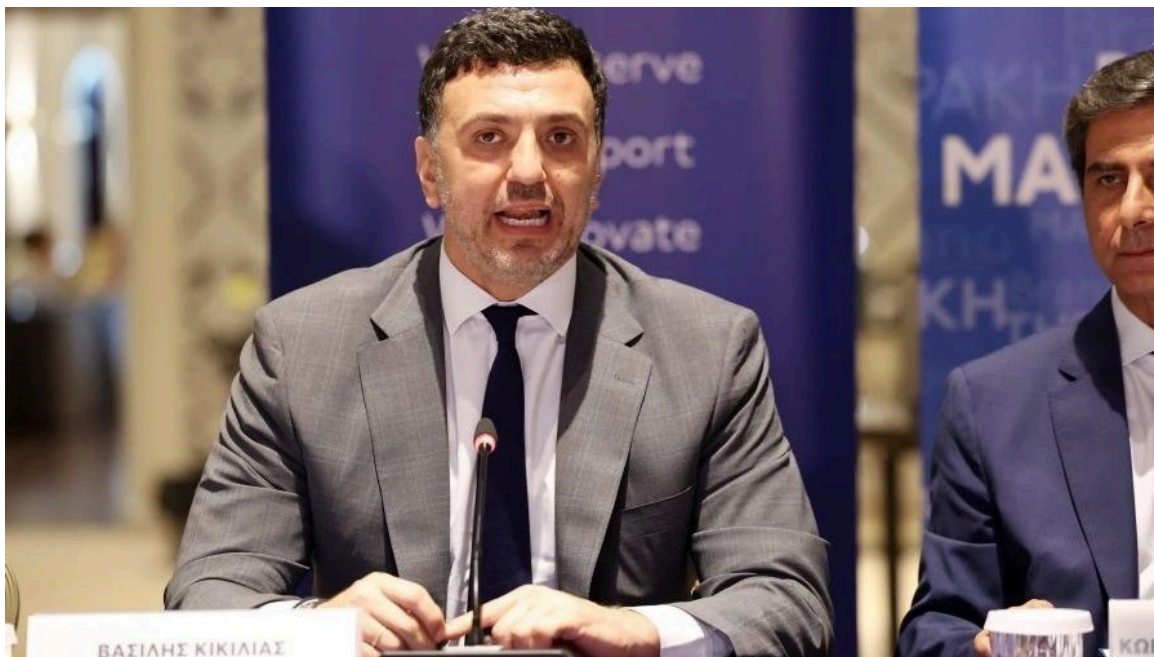
Ο υπουργός Κλιματικής Κρίσης και Πολιτικής Προστασίας, Βασίλης Κικίλιας

«Θα δίνουμε μάχη καθημερινά» υπογράμμισε, αναφερόμενος στην πυροπροστασία και στην Πολιτική Προστασία, ο Υπουργός Κλιματικής Κρίσης και Πολιτικής Προστασίας Βασίλης Κικίλιας , σε ευρεία σύσκεψη με αντικείμενο τον συντονισμό των φορέων της Μακεδονίας και της Θράκης σε θέματα πυροπροστασίας, την οποία συγκάλεσε το μεσημέρι ο υφυπουργός Εσωτερικών, αρμόδιος για θέματα Μακεδονίας - Θράκης, Κώστας Γκιουλέκας.