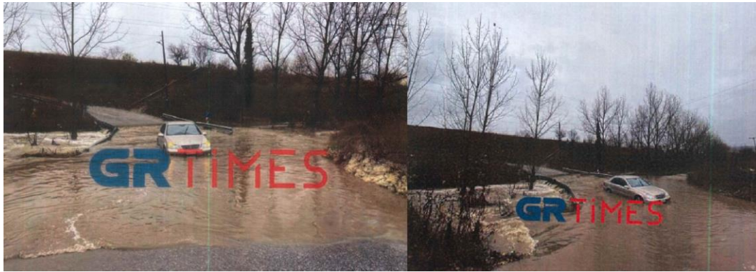
Εικόνες 5,6 : Φαινόμενα εγκλωβισμού οχημάτων επί της οδού Γεννηματά

τεχνικού έργου που θα εξασφάλιζε την ασφαλή διέλευση κατά μήκος της περιφερειακής τάφρου, με αποτέλεσμα κατά την διάρκεια έντονων βροχοπτώσεων να υπερχειλίζει η περιφερειακή τάφρος και να υπάρχει κίνδυνος παράσυρσης οχημάτων.