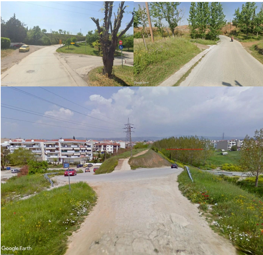
Εικόνες 2,3,4 : Υφιστάμενη κατάσταση διόδου

Η οδός Γ. Γεννηματά ανήκει στο βασικό οδικό δίκτυο σύμφωνα με το ΦΕΚ 561Δ/12- 10-1990, αριθμ. Αποφ 62555/5072 «Ορισμός βασικού Οδικού Δικτύου Θεσσαλονίκης», : 61. Οδικός άξονας Αναξιμάνδρου – Νεκροταφεία αναστάσεως – Θέρμη μέχρι διασταύρωση με οδό Θέρμης – Πανοράματος. Η διέλευση της οδού Γεννηματά από την περιφερειακή τάφρο προς την οδό Θεσσαλονίκης – Θέρμης, αποτελεί χάραξη μιας παλαιότερης οδού που προϋπήρχε της κατασκευής της περιφερειακής τάφρου. Μετά την κατασκευή της περιφερειακής τάφρου, ουδέποτε κατασκευάστηκε το απαραίτητο τεχνικό έργο προκειμένου να αποκαταστήσει την διέλευση της οδού Γεννηματά. Ως αποτέλεσμα, σήμερα η διέλευση της περιφερειακής τάφρου πραγματοποιείται δια μέσω πρόχειρης τσιμεντοστρωμένης διόδου, η οποία παρουσιάζει πλήθος προβλημάτων οδικής ασφάλειας (ελλιπής γεωμετρία, εκτεταμένες επιφανειακές φθορές κλπ).