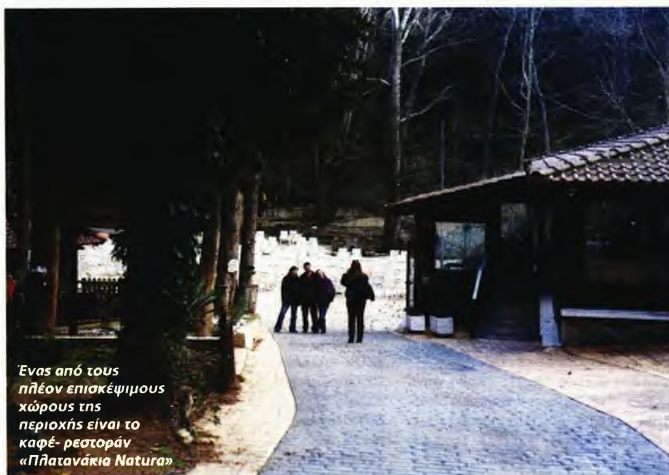
Ένας από τους πλέον επισκέψιμους χώρους της περιοχής είναι το καφέ-ρεστοράν «Πήατανάκια Natura»

καλλιέργεια, παρά την ύπαρξη υδραγωγείου πριν από την άλωση της Θεσσαλονίκης το 1430. Μέχρι και την άφιξη των προσφύγων, από το 1914 και μετά τη Μικρασιατική Καταστροφή, οι ιστορικές αναφορές κάνουν λόγο για τα λιγоста μέσα που διέθεταν οι γεωργοί και οι κτηνοτρόφοι, για να καλλιεργήσουν την περιοχή μέσα στις πέτρες, παρότι στο κέντρο της, στα Πλατανάκια, το ρέμα πότιζε τη γη.