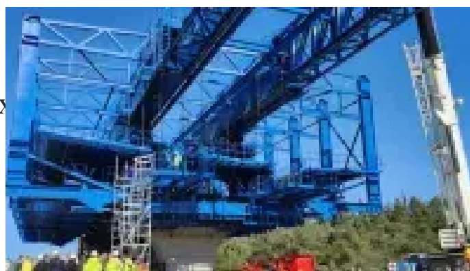
16.02.26 | 01:56

Φlyover: 48ωρος αποκλεισμός στην περιφερειακή οδό από αύριο – Σε πλήρη εξέλιξη οι εργασίες για τη νέα γέφυρα Πανοράματος – Πώς θα διεξάγεται η κυκλοφορία